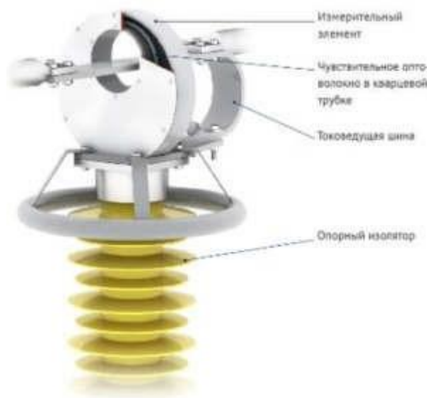
Рисунок 1.2 – Трансформатор тока электронный оптический

Электронные измерительные трансформаторы разработаны на базе традиционных трансформаторов и используют специализированные аналогово-цифровые преобразователи.