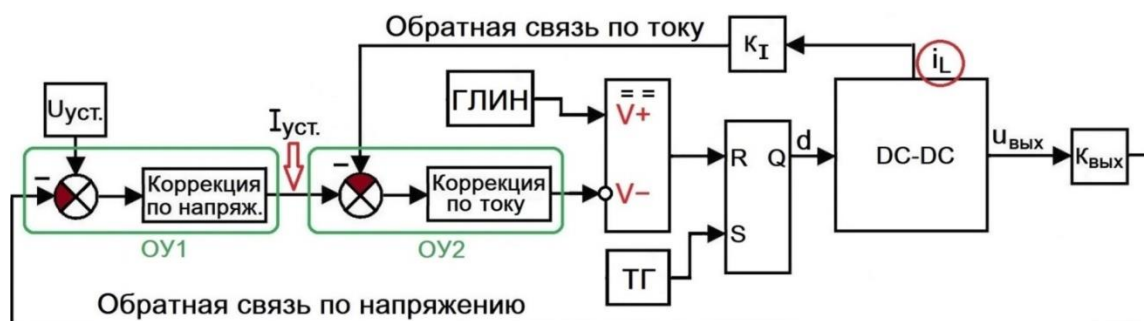
Рисунок 2 – Структурная схема замкнутой системы управления dc-dc-преобразователем с обратной связью по среднему току

9. Обеспечить запас устойчивости по фазе не менее 40 градусов для худшего случая из 4 сочетаний входного напряжения и мощности на выходе преобразователя. Измерить и указать в виде таблицы частоту единичного усиления, запасы по амплитуде и фазе для 4 режимов.