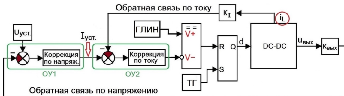
Рисунок 2 – Структурная схема замкнутой системы управления dc-dc-преобразователем с обратной связью по среднему току

9. Обеспечить запас устойчивости по фазе не менее 40 градусов для худшего случая из 4 сочетаний входного напряжения и мощности на выходе преобразователя. Измерить и